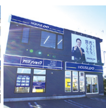
ハウストウ 白樺通