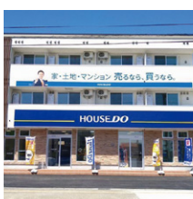
ハウストウ二の宮