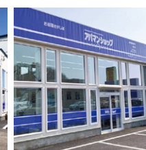
アパマンショップ 音更店