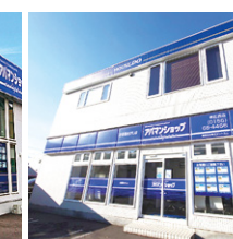
アパマンショップ 帯広西店