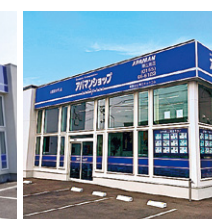
アパマンショップ 帯広南店