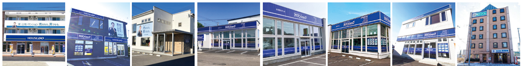
ハウズドゥ二の宮