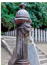
竜頭共用栓(水戸市 復元)▶

その後、水道は専用栓が作られるようになります。その際「蛇体鉄柱式共用栓」を元にして、名称を「蛇口」としたそうです。