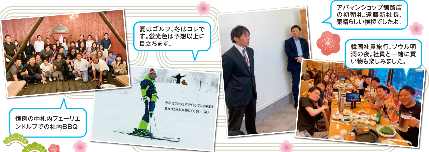
夏はゴルフ、冬はコレです。蛍光色は予想以上に目立ちます。