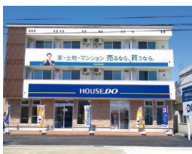
ハウストゥ二の宮