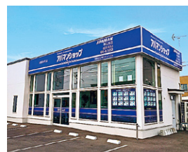
アバマンショップ 帯広南店