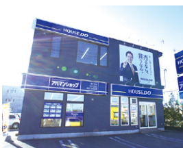
ハウストゥ 白樺通