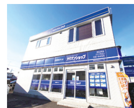
アバマンショップ 帯広西店