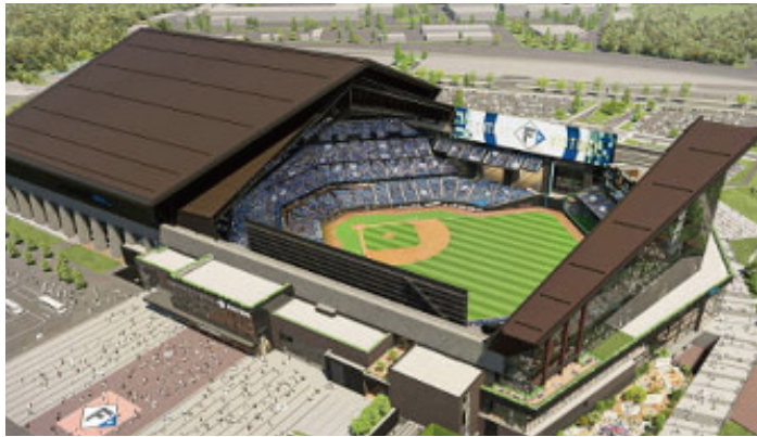
▲北広島市に建設がすすむ日ハム新球場「エスコンフィールド北海道」

●背景に日ハム新球場 北広島市の高騰の背景には、北海道日本ハムファイターズの新球場「エスコンフィールドHOKKAIDO」の完成があります。ボールパークから徒歩15分ほどの共栄町などの地価は軒並み上昇し、上昇率は全国1位になりました