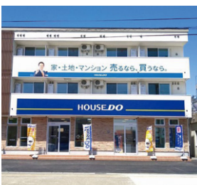
ハウストウニの宮 レントウニの宮通

本店 帯広市東3条南8丁目 ☎0155-24-2522 営10:00~19:00