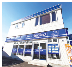
アパマンショップ 帯広西店