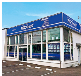
アパマンショップ 帯広南店