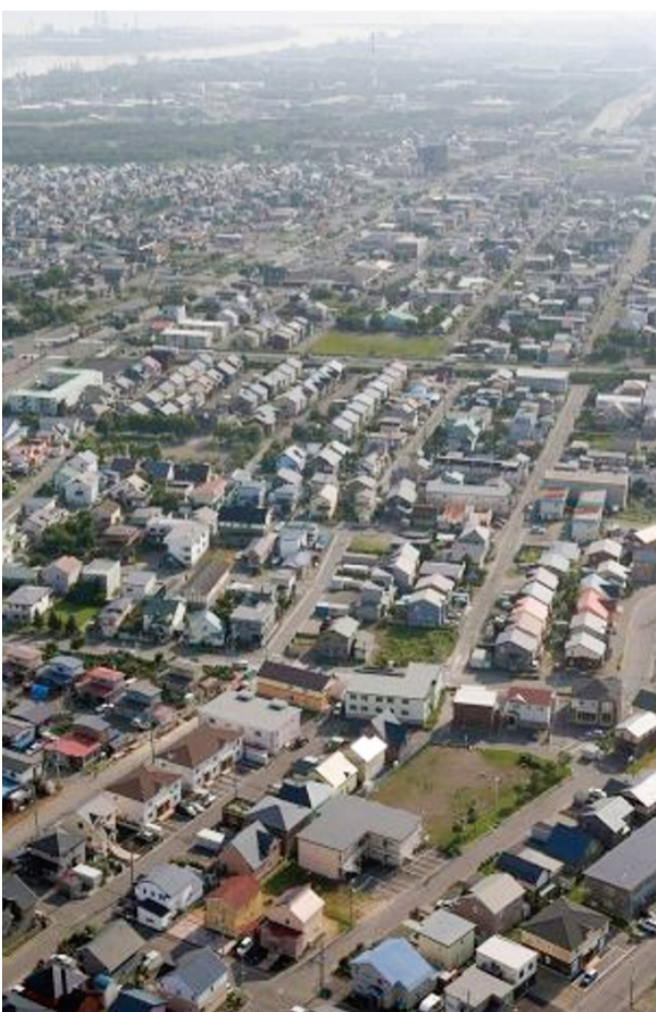
▶大手自動車メーカーの進出を皮切りに人口が増加した苫小牧沼ノ端地区