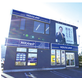
ハウストウ 白樺通