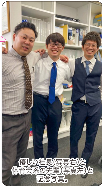
優しい社長(写真右)と 体育会系の先輩(写真左)と 記念写真。

CAFE GREEN (カフェ グリーン) 帯広市東3条南3丁目4番地25 池田ビル1階 ☎0155-27-3751 営業時間 / 8:00~翌1:00 定休日 / 不定休 https://officegreentale.com/cafe-green/