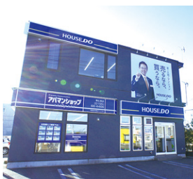
ハウストウ 白樺通