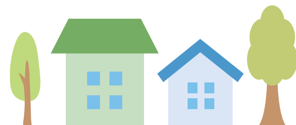
◀2021年度十勝管内建築確認申請施工業者ランキング (25位まで)