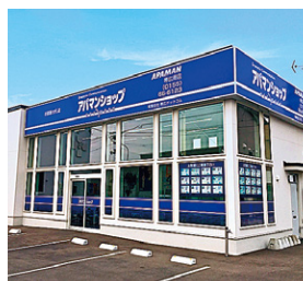
アパマンショップ 帯広南店