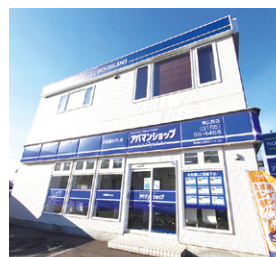
アパマンショップ 帯広西店