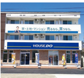
ハウストウニの宮 レントウニの宮通