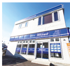
アバマンショップ 帯広西店