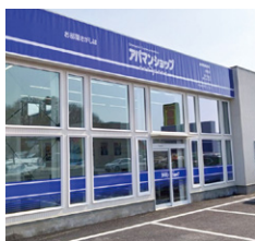
アバマンショップ 音更店