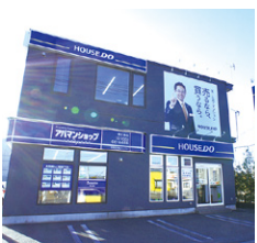
ハウズドゥ 白樺通