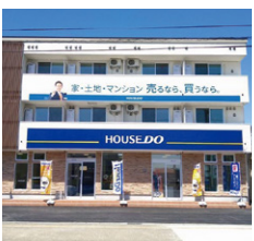
ハウズドゥ二の宮

参考・引用:国土交通省HP https://www.l.mlit.go.jp/report/press/content 株式会社不動産流通研究所リポート https://www.re-port.net/ 十勝毎日新聞電子版 https://kachimai.jp/article/index.php?no=605947