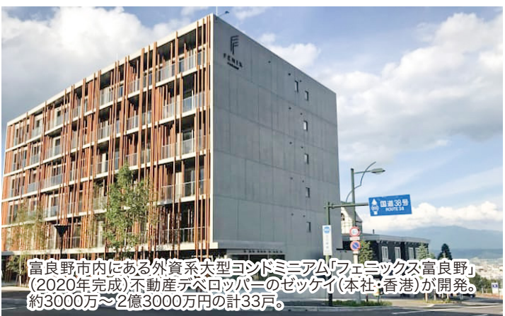
富良野市内にある外資系大型コンドミニアム「フェニックス富良野」(2020年完成)不動産テックローパーのセックイ(本社、香港)が開発。約3000万〜2億3000万円の計33戸。

変動率の全国上位10地点のうち、住宅地で7地点、商業地で道内の5地点が占めています。中でも富良野市はリゾート地の外国人向け別荘やコンドミニアムの需要が増大し、変動率は27.9%で、住宅地で全国1位の上昇。そのほか、千歳市で次世代半導体製造会社ラピダスによる工場建設や、関連企業の事業所用地、従業員向けの住宅用地の需要が旺盛で、高い上昇となりました。