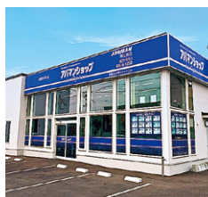
アバマンショップ 帯広南店